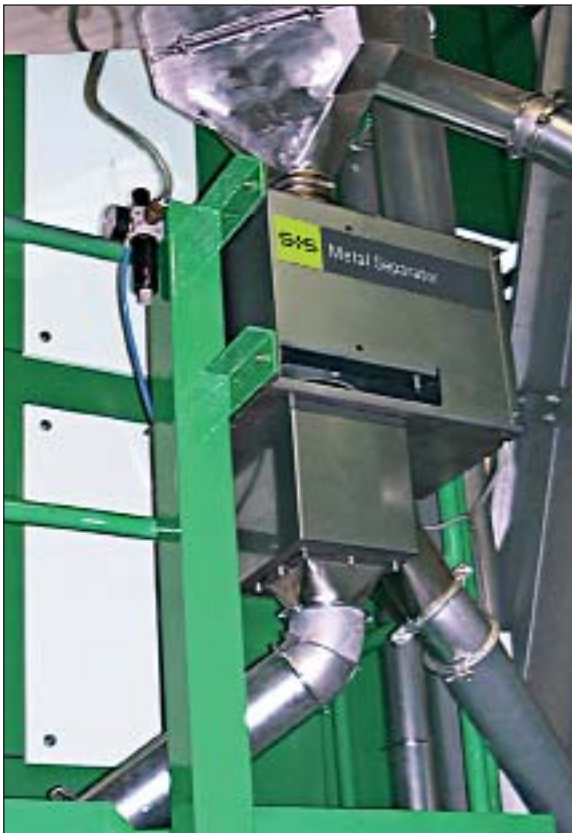
Séparateur RAPID 4000-FS utilisé pour le contrôle qualité de légumes déshydratés, sur un poste de conditionnement.