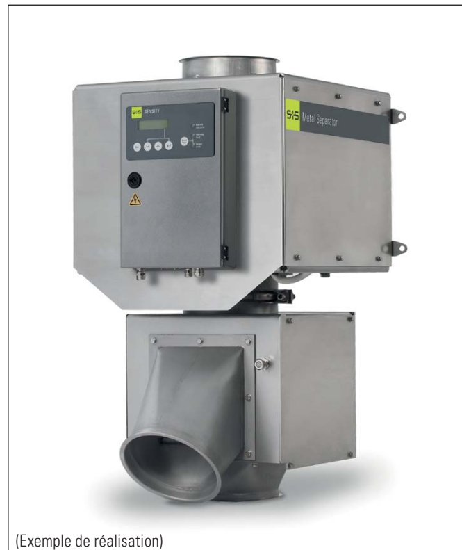
(Exemple de réalisation)